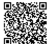
テクニカルノート