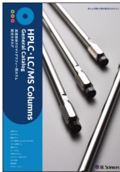
HPLCカラム総合カタログ

その他のInertSustain、Inertsilの詳細については、弊社ホームページをご参照いただくか、下記QRコードよりカタログをご確認ください。