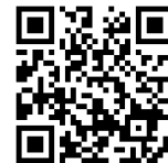
インターネット検索/テクニカルノート